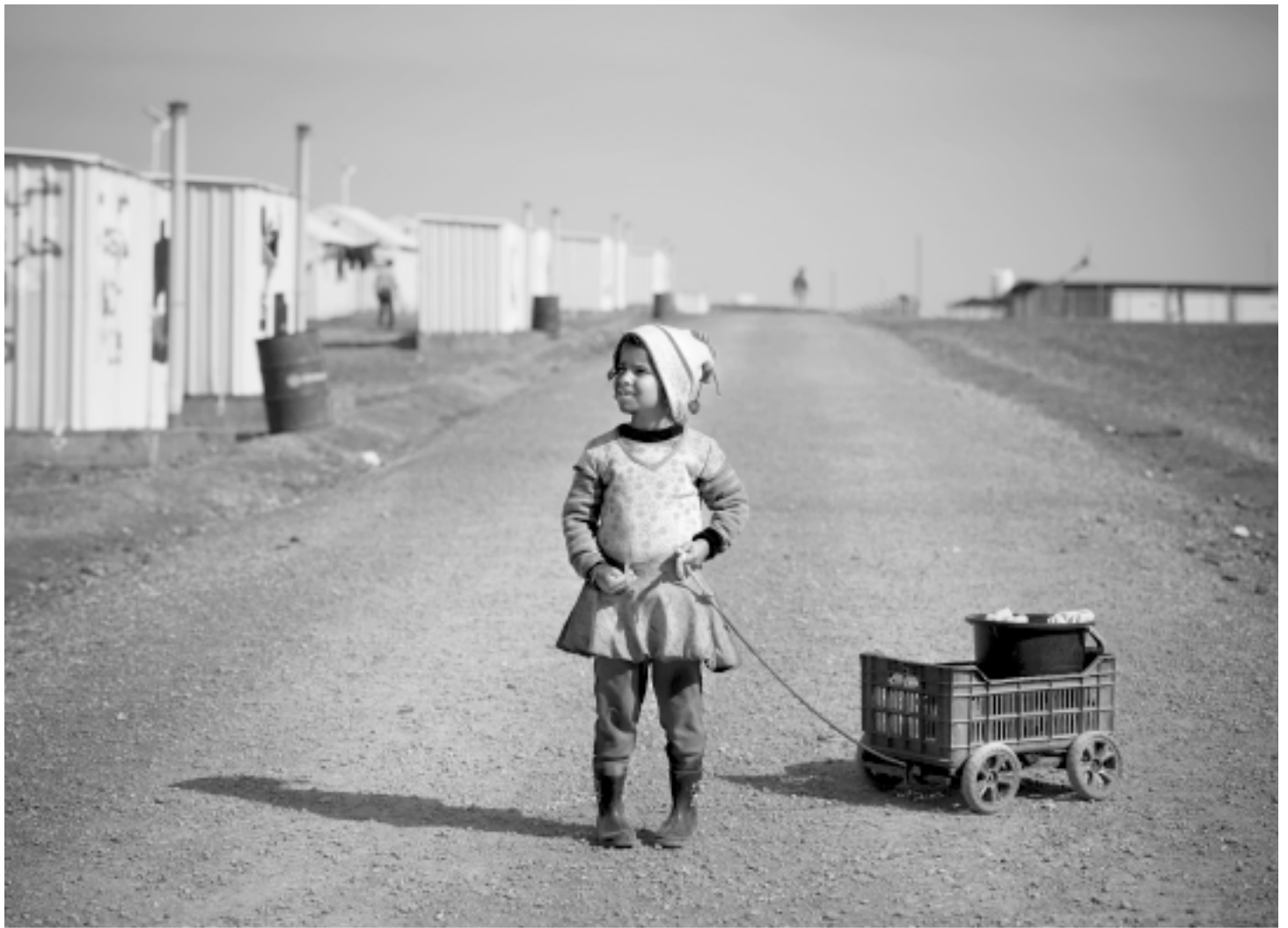
Djevojčica u kampu za izbjeglice iz Sirije.