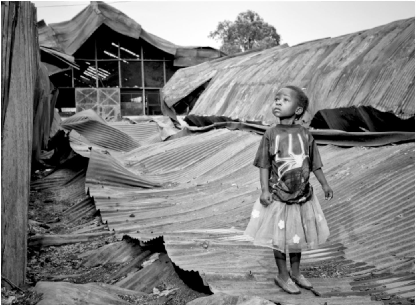
Djevojčica u kampu za interno raseljene osobe.