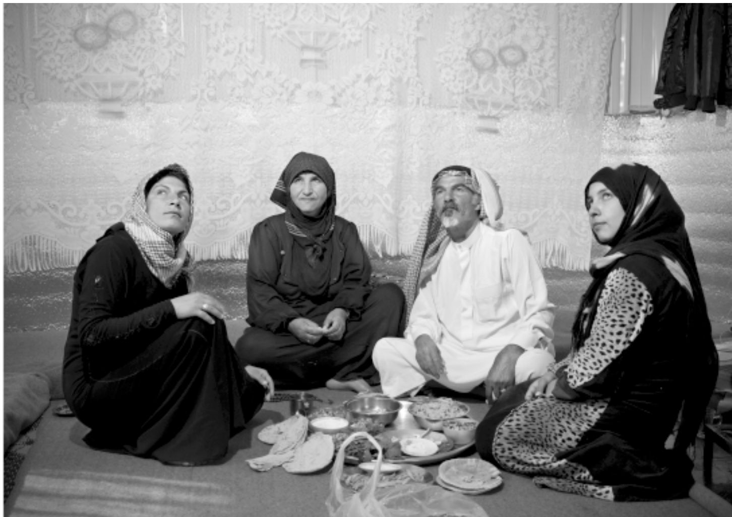
Sirijska obitelj u izbjegličkom kampu.