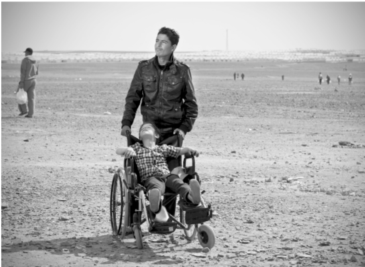
Kamp za izbjeglice iz Sirije.