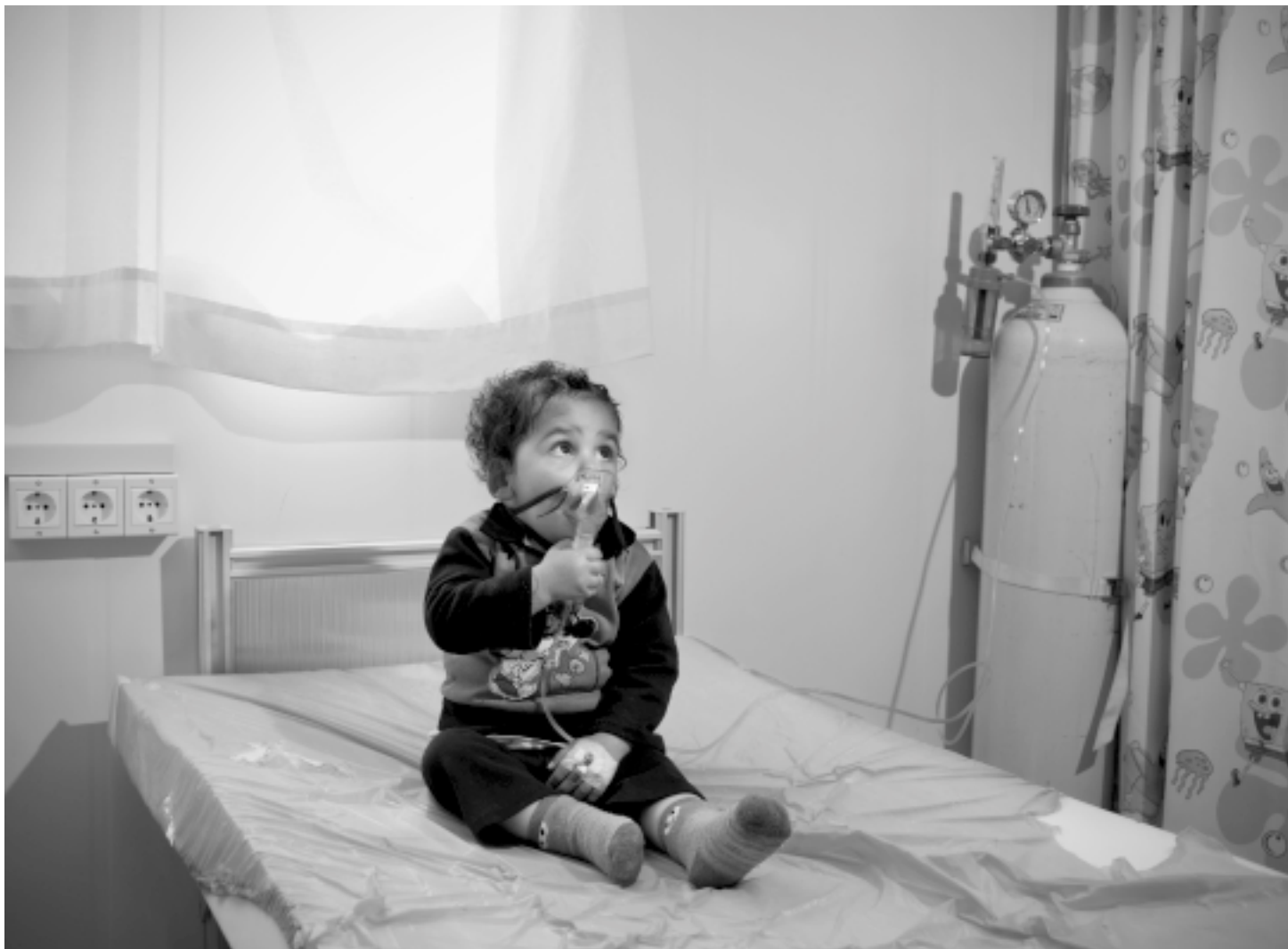
Dječak na liječenju u poljskoj bolnici Crvenog križa u kampu za izbjeglice iz Sirije.