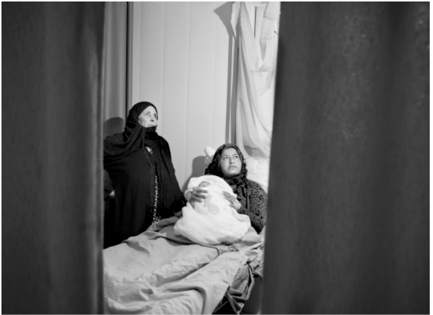
Novorođenče u kampu za izbjeglice iz Sirije.