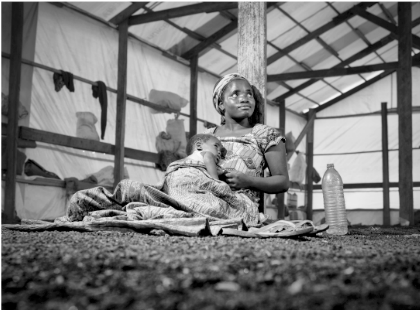
Majka s djetetom u kampu za interno raseljene osobe.